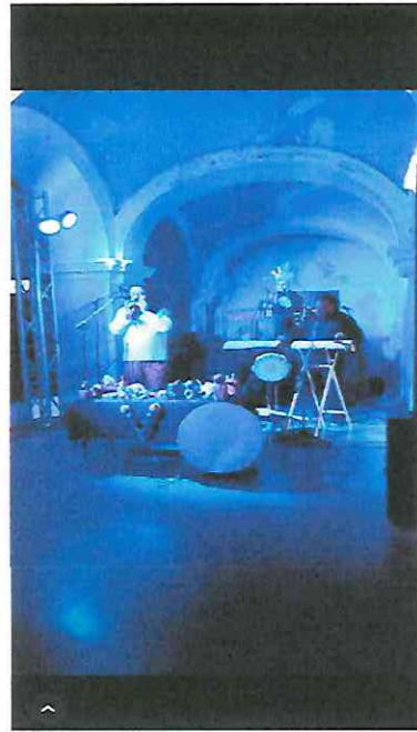
Interpretación de Flautas de Barro