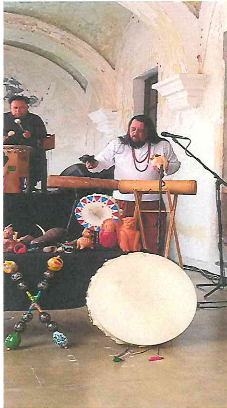
Interpretación del Tun o Teponaztli, acompañado del Tambor Huehuti, ambos de origen prehispánico en Mesoamérica.