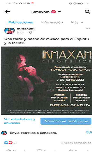
Publicidad en Páginas de Facebook