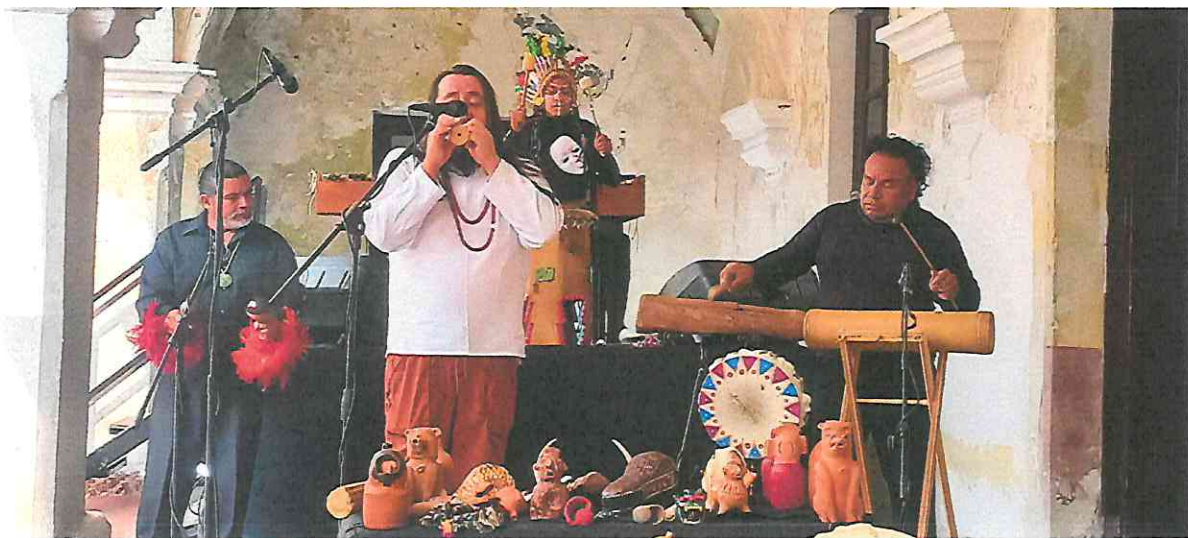
Recreación de Música Prehispánica Maya con Flautas de Barro, Tun, Sonajas y tambores.