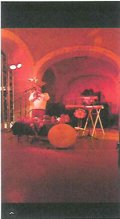
Presentación acompañada de Marimba