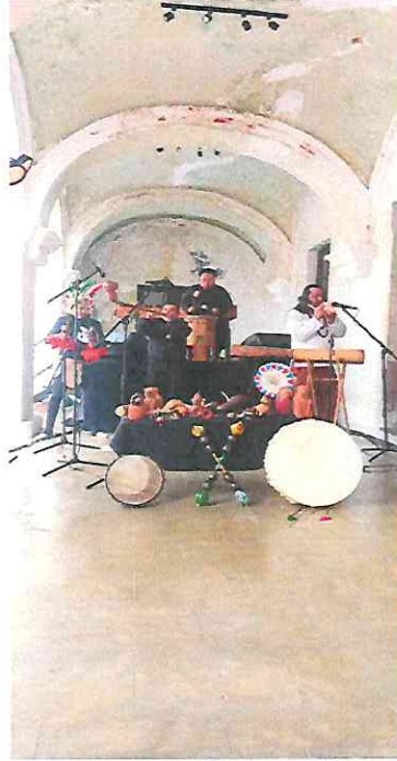
Interpretación de la caracola marina junto la Hompok o trompeta Maya.