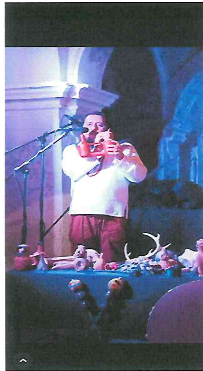
Presentación con Vasija Sibilante