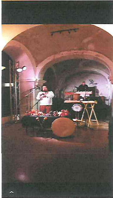
Interpretación del Tema: "Quimeras y resonares"