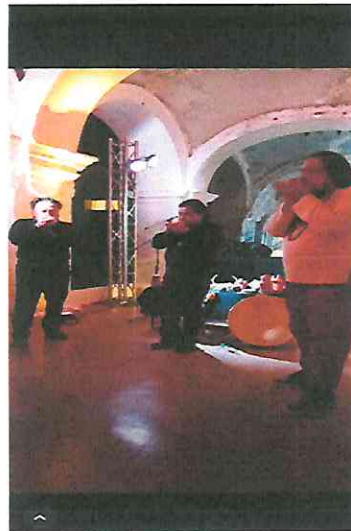
Interpretación de Silbatos de la Muerte